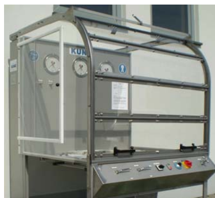
Прозрачный защитный кожух для Стенда для проверки тормозов BTS