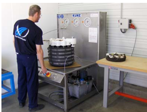
Стенд для проверки тормозов BTS-E

Для обслуживания тормозов А380 фирма КУНЦ разработала Стенд для проверки тормозов BTS-E с давлением 7500 PSI. В цехах по ремонту колес и тормозов в фирме Mazer Aero Equipment (Франция) и в компании Авиалинии объединенных Арабских Эмиратов (UAE) стенд BTS-E используется для полной функциональной проверки тормозов А380 и полностью соответствует всем требованиям.